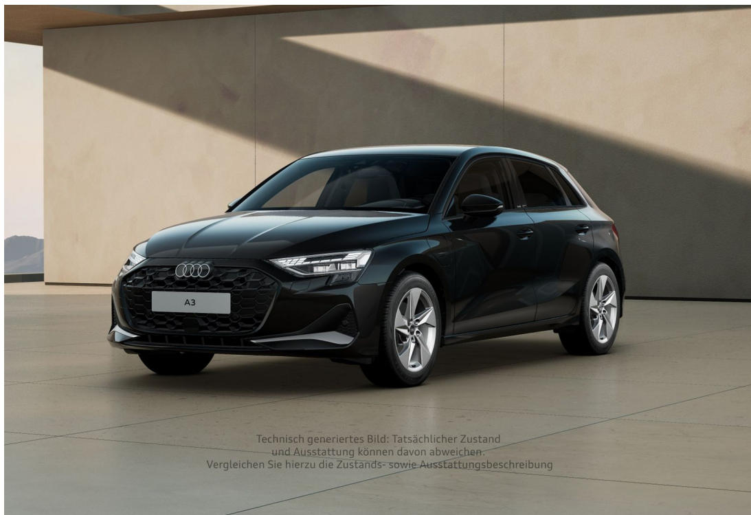
Technisch generiertes Bild: Tatsächlicher Zustand und Ausstattung können davon abweichen. Vergleichen Sie hierzu die Zustands- sowie Ausstattungsbeschreibung