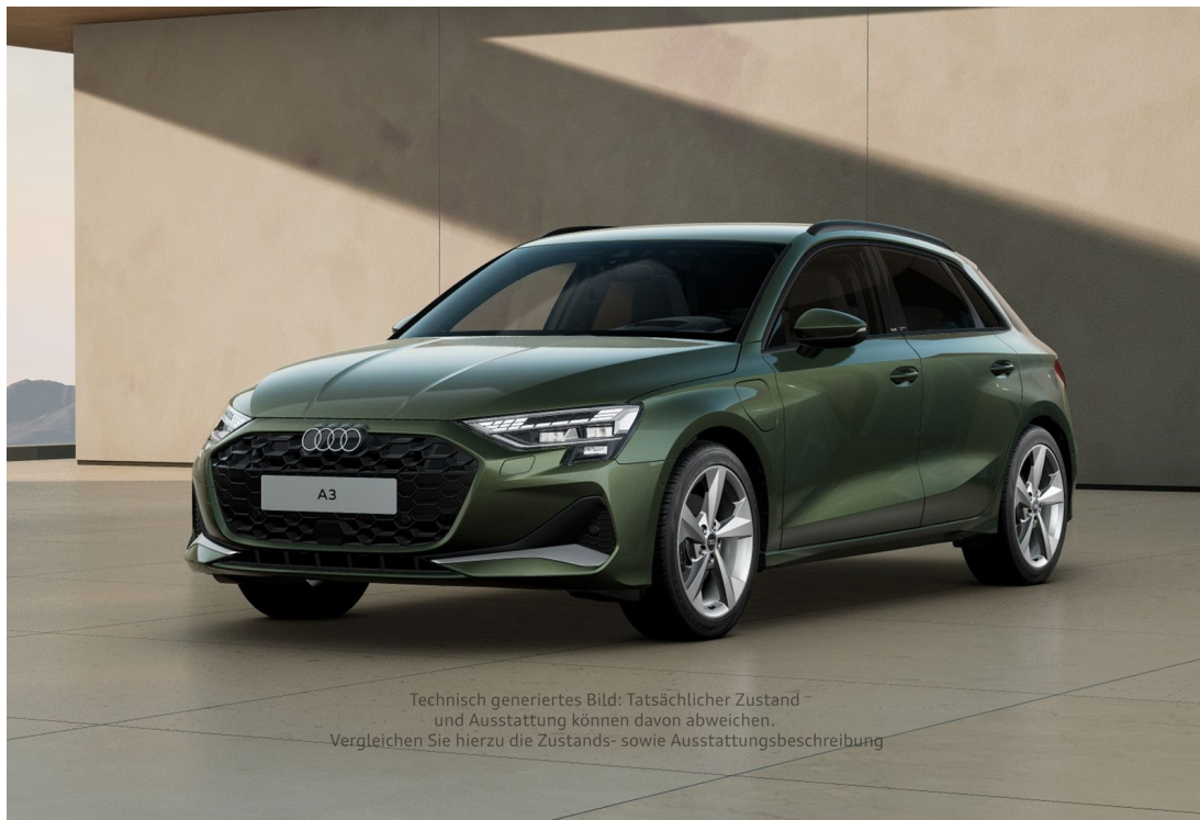
Technisch generiertes Bild: Tatsächlicher Zustand und Ausstattung können davon abweichen. Vergleichen Sie hierzu die Zustands- sowie Ausstattungsbeschreibung