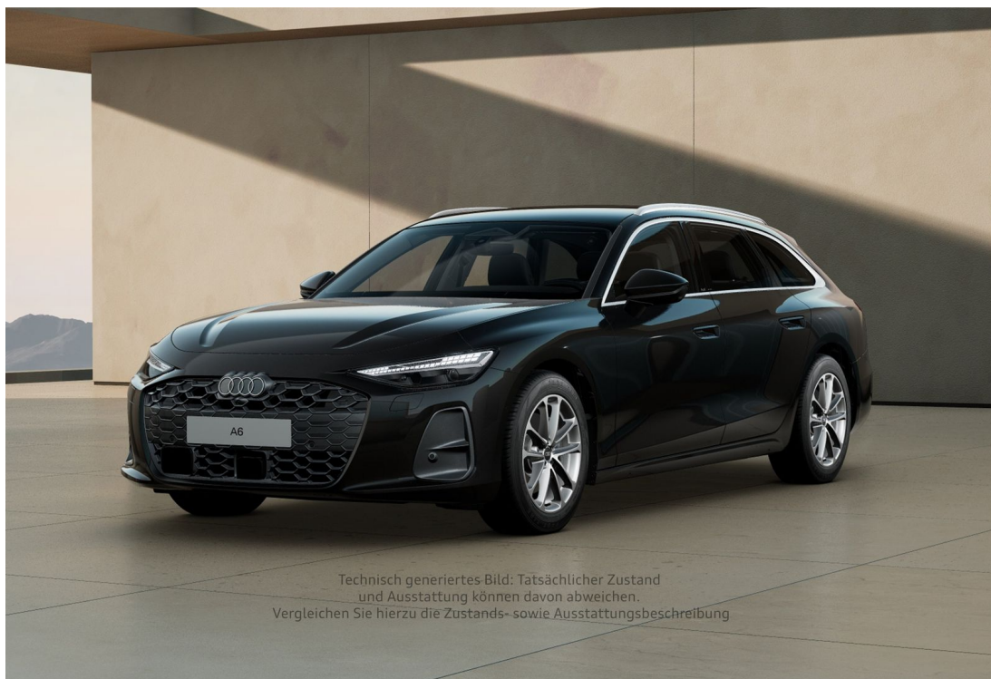
Technisch generiertes Bild: Tatsächlicher Zustand und Ausstattung können davon abweichen. Vergleichen Sie hierzu die Zustands- sowie Ausstattungsbeschreibung