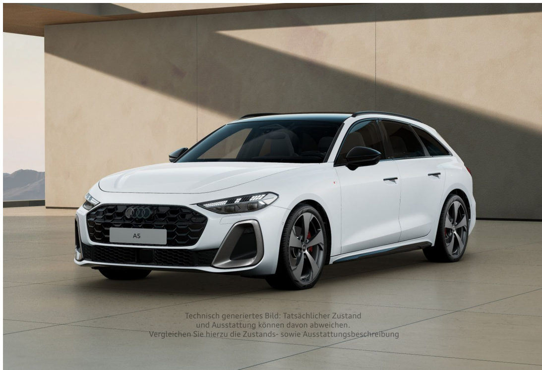
Technisch generiertes Bild: Tatsächlicher Zustand und Ausstattung können davon abweichen. Vergleichen Sie hierzu die Zustands- sowie Ausstattungsbeschreibung